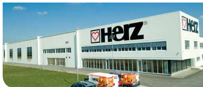
Centro de producción HERZ (Austria).

HERZ apuesta por la calidad de sus productos, así como por la investigación y el desarrollo para seguir ofreciendo una energía eficiente y sostenible.